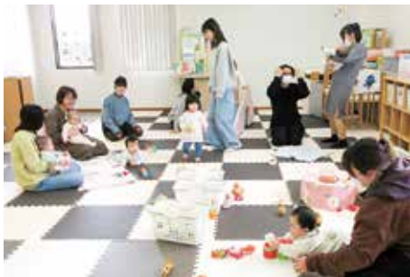
▲毎週木曜日の楽しみ会はたくさんの親子が訪れる人気の催しだ

0 3歳の未就園児とその保護者が気軽に集い、交流できる子育て広場「ほっとステーション九ちゃんクラブ」。今年で開設20周年という大きな節目を迎えた。 同クラブは、平成17年10月に九日町のイスマミ本店3階で開所。親同士の交流や情報交換の場として機能してきた。当初は、商店街の人と季節の行事をしたり、商店街のお店で体験活動をしたなど、商店街が子育て支援を担う県内初の取り組みとして注目を浴びた。平成22年に、九日町通りの空き店舗に移転。令和2年7月の豪雨災害では活動拠点が被災したが、地域の支援を得て、肥後銀行人吉支店1階、そして令和5年からはカル