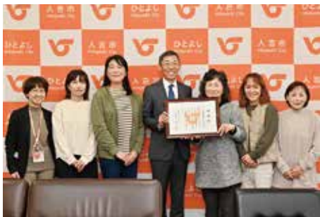
▲令和7年12月17日には人吉球磨陽だまりの会に市長から感謝状が贈られた