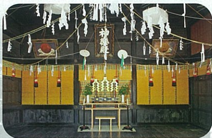
かぐらでん 神楽殿