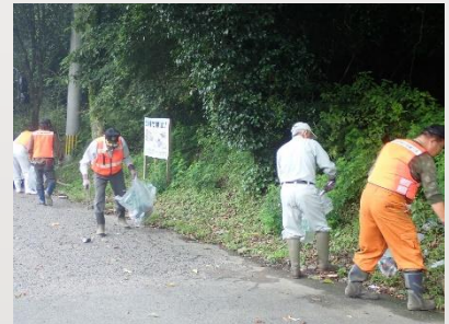
人吉市衛生員連合会の清掃活動 →