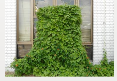
グリーンカーテンづくり