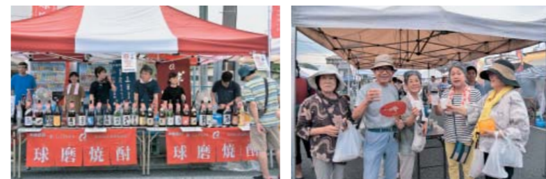
銘柄の説明やおすそめを聞き、お気に入りの焼酎を見つけるのも楽しみの一つ (上) / 焼酎とおつまみを調達したらその場で宴会スタート! (下右) / 味わいごとに28蔵元の焼酎がずらりと並んだ球磨焼酎のブース (下左)

九日町一帯を中心に、「人吉ふれあい100円商店街」が7月24日に開催されました。この催しは、平成24年7月の第1回から約3カ月に1回のペースで開催。店の軒先に100円で買うことができる商品が並び、商店街全体が一つの100円ショップになるイベントです。15回目今回は、初めて夕方に開催。涼しくなるに連れて客足は伸び、多くの家族連れなどにぎわいました。また、当日は同時刻に「100円焼酎フェス」も開催。人吉球磨28蔵元の球磨焼酎が1杯100円で飲めるという、うれしいイベントです。焼酎を引き立てるおつまみメニューの出店もあり、観光客から地元の焼酎好きの人まで焼酎片手に大いに盛り上がりました。