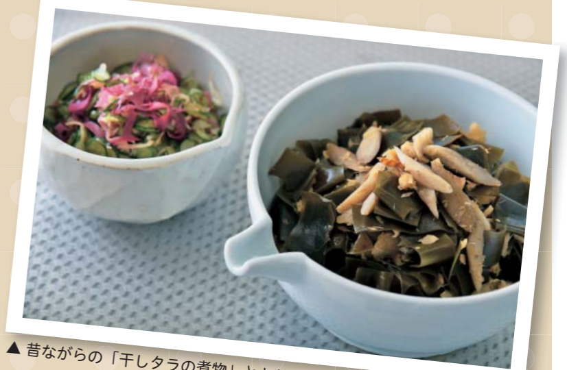
▲昔ながらの「干しタラの煮物」とトサカノリとキュウリの酢の物(奥)

夏は酢の物も欠かせません。人吉球磨地方の酢の物は、海藻のトサカノリを入れるのが特徴です。合わせ酢を酢みそに変えてもおいしくいただけますよ