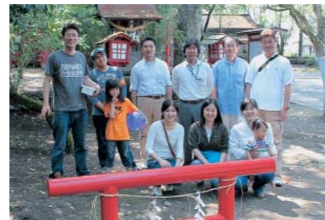
(上) 5月に開催された織月まつりの様子 (下) 新町デザインプロジェクトの皆さんと