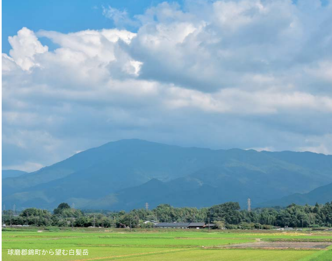
球磨郡錦町から望む白髪岳

普段の生活では感じる事ができない山の魅力を体感するために、「人吉山の会」の皆さんと山登りに挑戦しました。