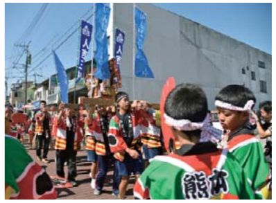
▲プロジェクトを活用し、おくんち祭に参加しよう