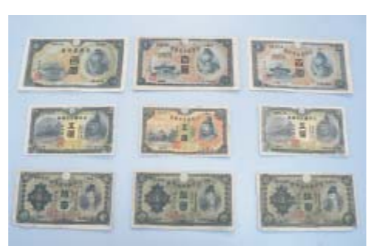
▲預かっている通貨の例

かった通貨や証券類を返還しています。 返還は、本人だけでなく家族の方も請求することができます。心当たりがある方は、お問い合わせください。 問合せ 長崎税関税関相談官(☎0120・828・680)