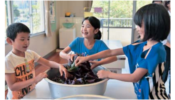
シソの葉を手でもみ子どもたち

市梅園で収穫したウメの加工に取り組み大畑小の3年生11人が、7月15日に梅干し作りに欠かせないシソの葉加工を体験しました。総合学習「大畑の宝を知ろう」の一環で体験。子どもたちは虫や異物がないか確かめながら葉を摘み取り、葉に塩をかけて手でもみこんだ後、梅酢を入れる工程を行いました。最初はぎこちない手付きでしたが、講師を務める地元の方に教わりながら楽しく上手にできていました。今後はウメを天日干しした後、漬けていただきます。