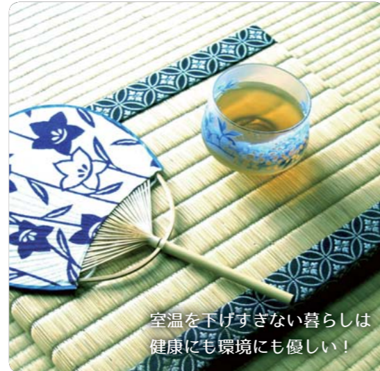
室温を下げすぎない暮らしは健康にも環境にも優しい!