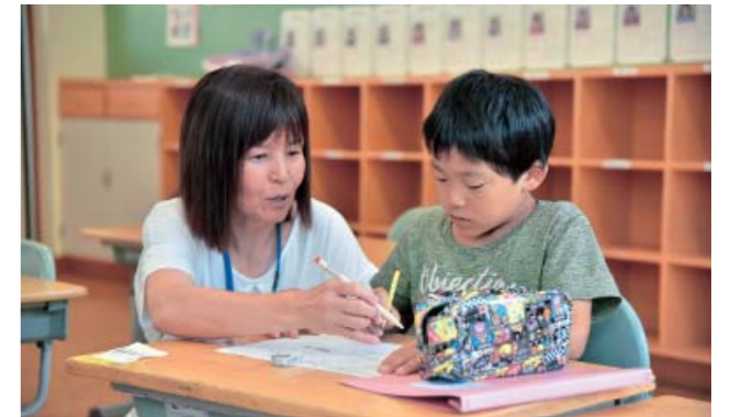
間違えた箇所の解説を聞く生徒

市内の小学3年生を対象にした「夏休みパワーアップ教室」を7月21日～29日に開講しました。9年目を迎えるこの取り組みは、夏休み期間に1年生からの国語と算数の復習を行い、苦手な部分を克服することで学習意欲を高めることが狙いです。教える先生は、元教師などの学習サポートや支援員のほか、球磨工高の生徒も協力。子どもたちは市教育委員会が作ったプリントに取り組み、1枚でできるごとに先生にマルを付けてもらい、まちがった箇所の解説に耳を傾けていました。