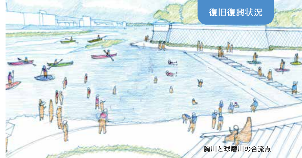
胸川と球磨川の合流点