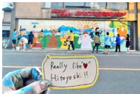
▲撮影例。ステッカーと一緒に、自分が好きな場所や瞬間などを写真に撮って投稿を目指す。