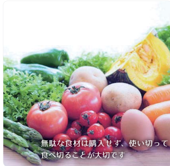
無駄な食材は購入せず、使い切って食べ切ることが大切です