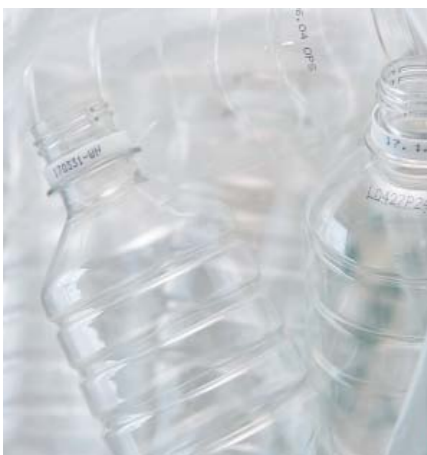
▲ペットボトルはフタとラベルを取り、軽くすすいで乾燥させてから指定のごみ袋で出します