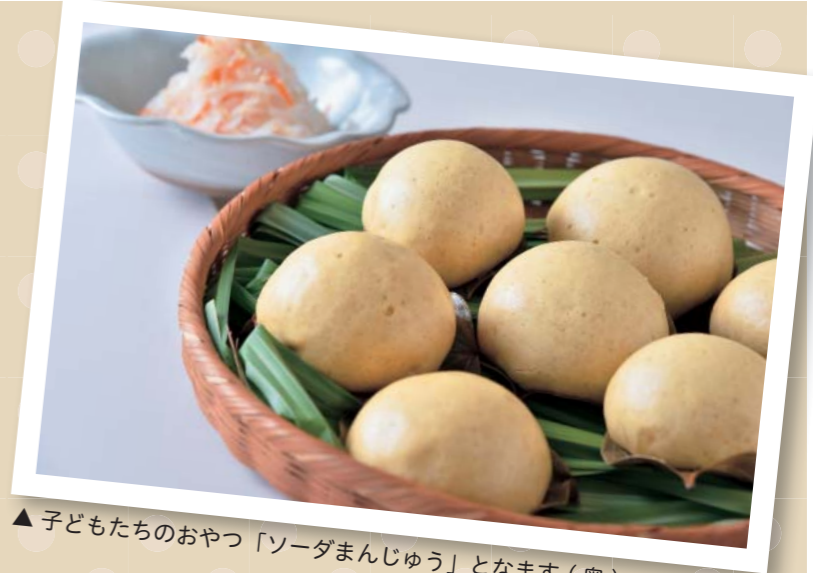
▲子どもたちのおやつ「ソーダまんじゅう」となます(奥)

ソーダまんじゅうは、あんこを包むときに表面を撫でておくと、皮がつるっときれいになります。千切りにしたダイコンとニンジン塩で軽く揉んだものに甘酢を合わせたなますは、人吉球磨地方の定番料理。これからの時期は、柿を混ぜ合わせた「柿なます」がおすすめです