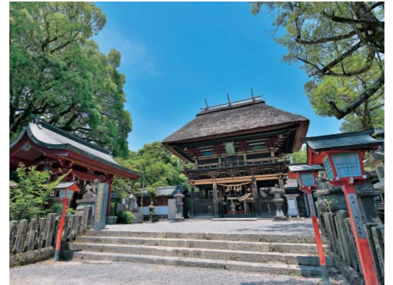
▲“青井さん”として親しまれている青井阿蘇神社(楼門前)

相良700年の保守と進取といえる青井阿蘇神社の建築様式は、この地方の近世社寺建築に大きな影響を与え、老神社や生善院観音堂にもその特徴が見られます。