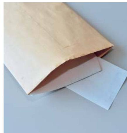
▲名刺サイズ以上の紙は資源ごみです。小さい紙は封筒に入れて雑誌などと一緒に縛って出します