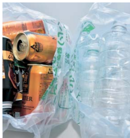
▲資源ごみを指定の袋で出すときは種類ごとに分けて出します。1つの袋に2種類以上入れてはいけません