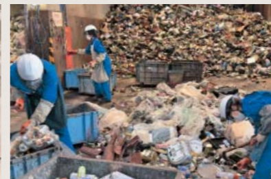
▲大量の不燃ごみを分別する作業員。多くの手間と時間が掛かる