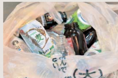
▲不燃ごみの袋の中に、たくさんの資源ごみが入っていることも

却温度が上がりにくく焼却効率が悪くなってしまい、燃料費が増加する可能性があります。水切りを行い燃料費の削減につながりましょう。 資源はリサイクル 不燃ごみの中にも資源ごみや可燃ごみの混入が多くみられます。特に資源ごみの混入が多く、人吉球磨クリーンプラザで職員が分別しますが、多くの手間と時間が掛かります。資源になるごみは、出し方を守って資源ごみとして出してもらうことで、ごみの減量、循環型社会の構築につながるのです。改めてごみの正しい出し方を確認し、ごみ出しにご理解とご協力をよろしくお願いします。