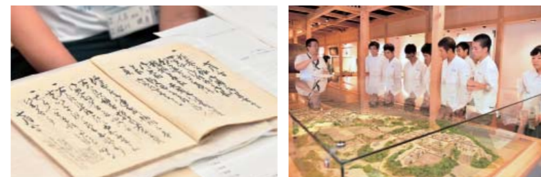
歴史学の楽しさや歴史に関する疑問について講師から話を聞く高校生たち(上) / 学芸員の説明で人吉城歴史館を見学(下右) / 昔から残る古文書。古文書や土器などを実際に見て歴史学の魅力を感じた(下左)

歴史に関する職業を目指すなど歴史に興味がある高校生を対象に、8月16日に人吉城歴史館で「相談してみよう、歴史のこと」を開催しました。歴史の魅力を理解してもらい、芸員などが進路の相談に乗るもの。初めての開催となった今回は、人吉高と球磨工高の生徒14人が参加。始めに、市の学芸員が歴史学の楽しさを話し、教員や出版社、建設業など歴史学が生かせる職業を紹介しました。学芸員の説明を受けながら人吉城歴史館を見学した後、高校生たちは学芸員や人吉市文化財保護委員、現役大学生との相談会に参加。高校生は、将来の夢や歴史学を生かせる進路、伝統建築に関する相談など、歴史に関する疑問を講師に聞いていました。