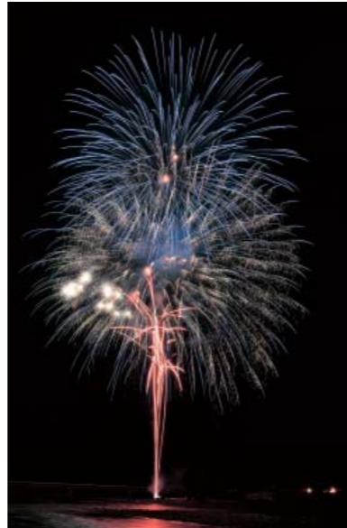
夜空を彩った5,000発の花火

62回目を迎え た人吉花火大会 を、お盆の8月 15日に中川原公 園を打ち上げ会 場に開催しまし た。観覧会場に は帰省客など市 内外から訪れた 約5万5千人の 観覧客が訪れ、夜空を彩る大輪の花を楽しみました。 14日で熊本地震発生から4カ月を迎えたことで、ことしは追悼と復 興への思いを込めた特別な花火大会に。スポンサーからは「がんばろ う熊本」「がんばろう人吉」と多くのエールが会場に響き渡りました。 特大や連発、仕掛花火など約5千発の花火が夜空を彩り、観客からは 大きな歓声や拍手が送られていました。