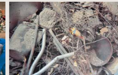
▲可燃ごみに出され、焼却炉の中に残った鉄くず。機械故障の原因になる