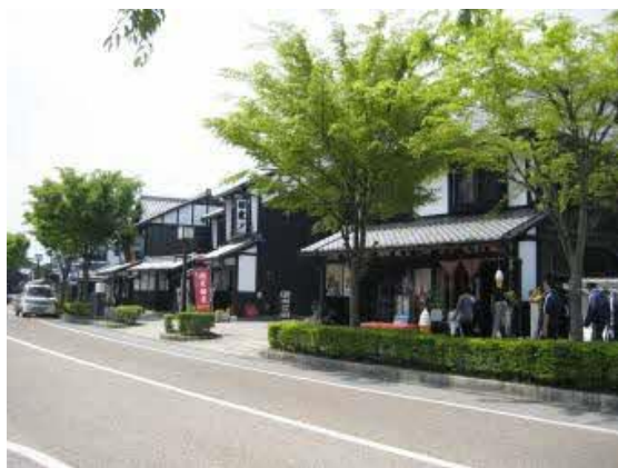
拡幅に合わせて作られた まちなみ