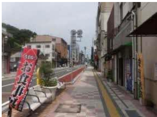
ひと休みできるベンチ はおもてなしの表現

青井地区ならではの日常遣い、イベントでの活用について。 これまでのみなさんの習慣などもふりかえりながら、 アイデアをください。