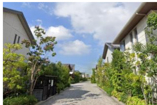
多様な植栽が目を楽しい 緑豊かな住宅地