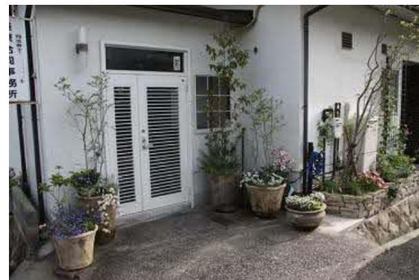
玄関先のコンテナ その家ならではの工夫