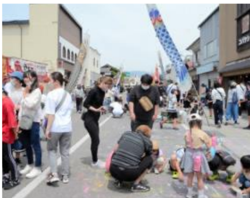
歩行者天国にすると、 道がくつろぎの場に