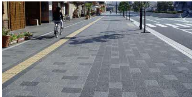
透水性のあるアスファルトやブロック系舗装の例