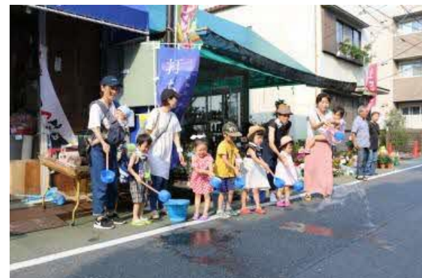
地域の習慣が、風景を 作り出す例