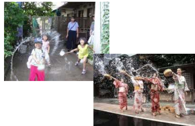
打ち水のイメージ