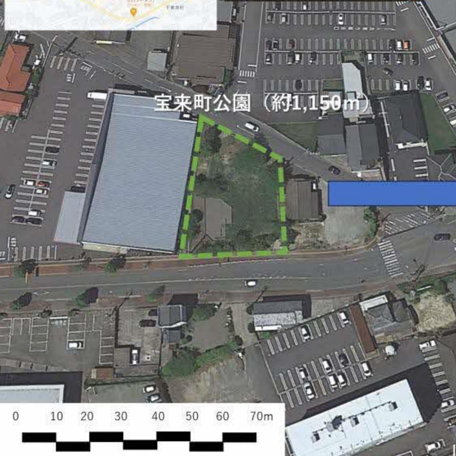
宝来町公園 (約1,150m 2 )