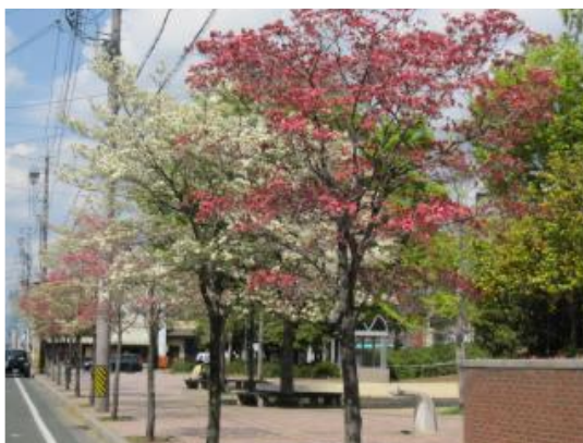
あまり大きくならず、 花が美しい中木