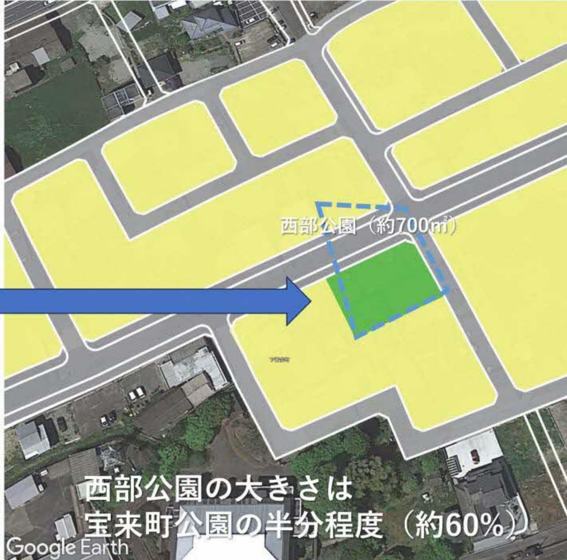
西部公園 (約700m 2 )