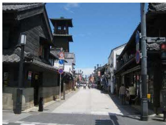
大火の後に不燃化を進めた 川越のまちなみ