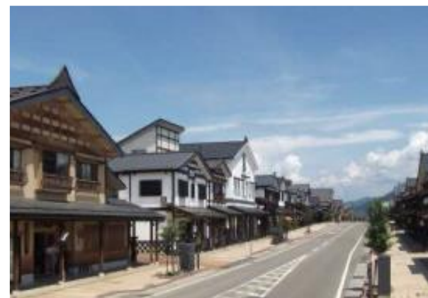
街並み配慮の先進事例