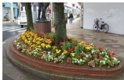
アクセントになる 花壇は、気持ち が嬉しくなる