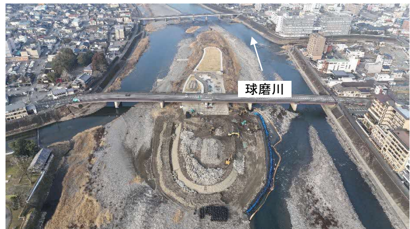
R8.2末 護岸工事の状況

※ 整備内容は設計段階を示しているため、現地状況により変更になる場合があります。