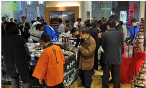
連日大盛況となった東京都庁の会場

11月23日から29日までの1週間、東京都庁で人吉球磨の物産・観光フェア「人吉球磨の味めぐり」が開催され、生クラゲや漬物などが完売するなど大盛況でした。このフェアは市を中心として、人吉温泉観光協会や物産振興協会、JA女性部などが連携し、物産品はもとより人吉全体を売り込もうと初めて企画されたものです。来場者には郡市内出身の方も多く、故郷の物産品や飛び交う球磨弁を懐かしがる場面も。今回の好評を受け、人吉市では今年も同様のフェアを開催する予定です。