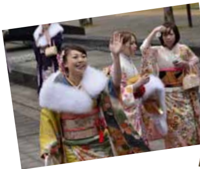
▲友人との久しぶりの再会に、思わず笑顔がこぼれます