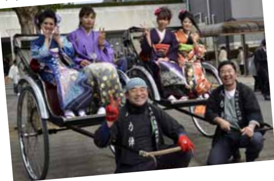
▼人力車も新成人の門出に花を添えました