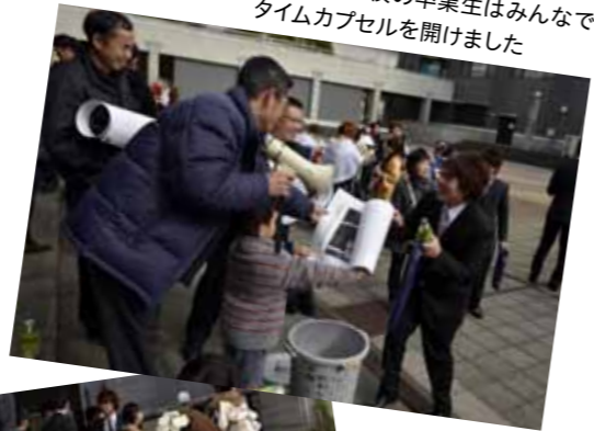
▼中原小学校の卒業生はみんなでタイムカプセルを開けました