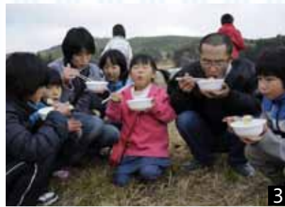
1_高さ約15mの櫓。今年は復興の祈りも。2_辰年の年男・年女が点火。3_振る舞われた豚汁で冷えた体を温める。4_地元住民や帰省者など約90人が集まった。5_燃えさかる炎。15分ほどで櫓は燃え落ちた。