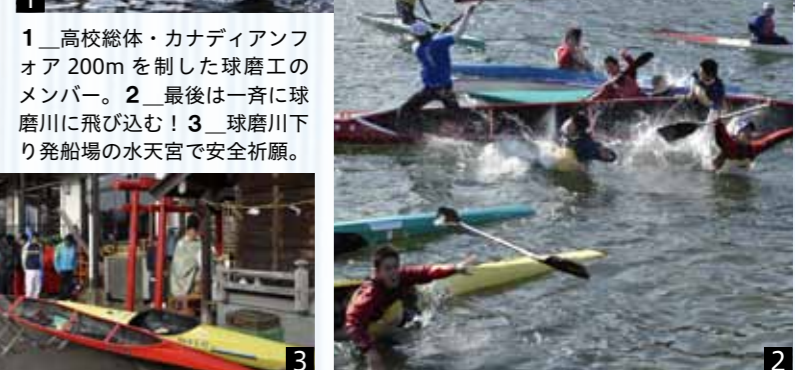
1_高校総体・カナディアンフオア200mを制した球磨工のメンバー。2_最後は一緒に球磨川に飛び込む! 3_球磨川下り発船場の水天宮で安全祈願。

全国屈指の強豪・球磨工カヌー部の新キャプテン。「日頃の練習も優勝することを想像しながら取り組み、チーム内の意識を高めて頑張りたい。そして、日本一のキャプテンになりたいです!」