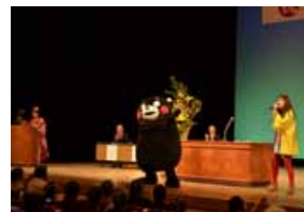
突然会場に現れたくまモン。サプライズな演出に会場が沸きました