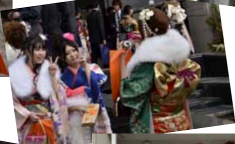
◀晴れ姿をパチリ。あちこちで記念撮影大会が始まります