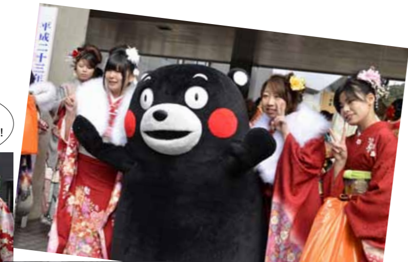
▲くまモンは記念撮影にひっぱりだこ