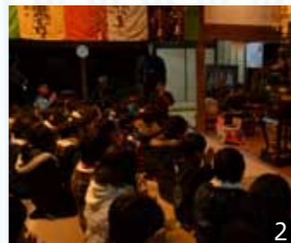
1、2_本堂に集まり、般若心経を唱える子どもたち。3_6日は上原町方面に向かって。寒行は3回に分けて行う。