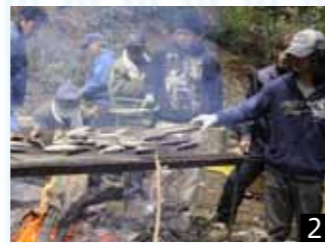
1_山の神をまつたほこらに手を合わせる子どもたち。2_まつりに欠かせない塩イワシを焼く。3_ほこらの前で「エイエイオー!」4_紅白に分かれてチャンバラ開始!