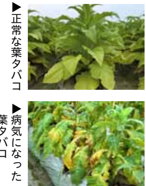
▶正常な葉タバコ ▶病気になった葉タバコ

ジャガイモとタバコのほ場が100m以上離れると、アブラムシによる伝搬の危険性が減ります。 アブラムシの防除をしっかり!