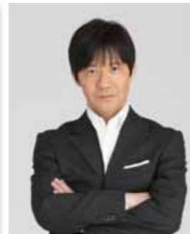
てるよし 内村 光良さん 47歳 お笑いタレント