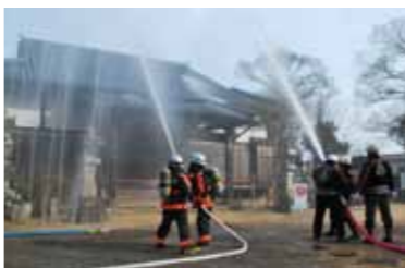
昨年の様子 (大信寺)