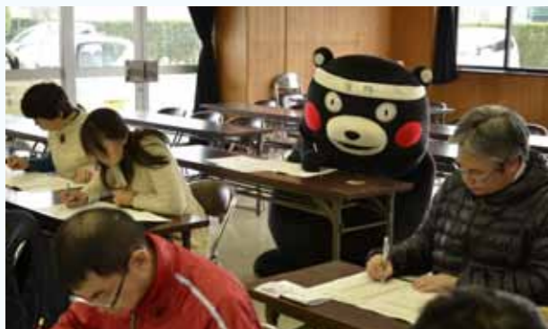
真剣に人吉球磨検定に取り組む受験者とくまモン

人吉球磨の文化や歴史、自然などの知識を問う人吉球磨検定が11月27日に開催され、93人が挑戦しました。第3回となる今回は人吉市と熊本市の2会場で行われ、「超難関」という1級の試験も初めて実施。人吉会場には、「合格」の鉢巻きを締めたくまモンも現れ、3級を実際に受験しました。受験勉強を重ねてきたというくまモンですが、途中鉛筆を転がす場面も……。受験後は「ますます人吉球磨のことが好きになったモン」と話していました。結果は、100点満点中92点で、見事合格したそうです。