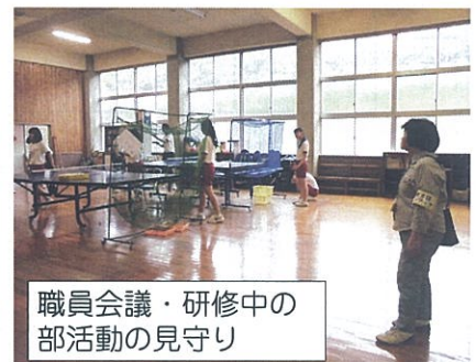
職員会議・研修中の部活動の見守り