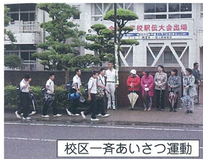
校区一斉あいさつ運動