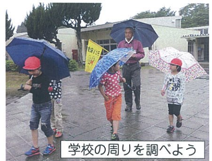
学校の周りを調べよう