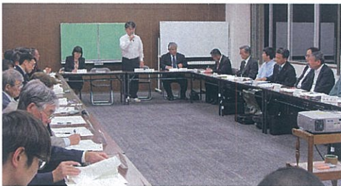
第1回人吉市学校支援推進協議会

地域で子どもたちを支え・見守り・育てる、人吉市学校支援地域本部事業「われら 人よし 生き域 学校応援団」も今年度で7年目になります。