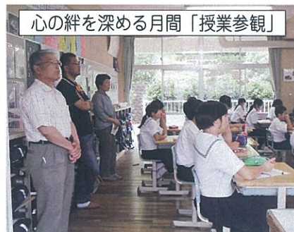
心の絆を深める月間「授業参観」