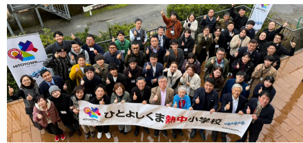
授業の後は、講師の先生を囲んでみんな笑顔で記念撮影。ワクワクできる新しい仲間との出会いが"あなた"を待っています。