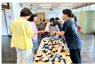
生徒ボランティアスタッフで楽しみながら授業運営も行っていきます。