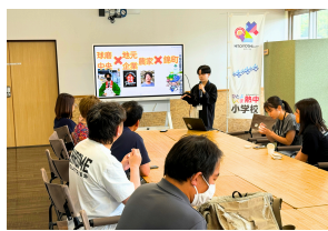
様々なジャンルの先生が授業を行います。体験型のクラブ活動も開催、新しい仲間づくりを。

熱中小学校とは、『もういちど7歳の目で世界を…』をテーマに全国で活躍する一流の起業家・経営者・大学教授・デザイナーや芸術家など豪華な講師陣が様々なトピックの講義を行い、地域の人材育成・異業種間交流・地域間交流などに取り組み授業を展開する"学びたい大人の社会塾"です。ひとよしくま熱中小学校では、第9期生(2025年10月～)として、起業家や自営業者、自治体関係者、会社員、学生など経歴・年齢さまざまな131名の生徒が入学し、新しい出会いと学びの場を提供してきました。「学びの力を人の力に。」新しい物事を見て、新しい世界を表現していく。想いのある個人同士がつながり、一緒にアクションを起こす仲間づくりを。あなたも仲間になりませんか？