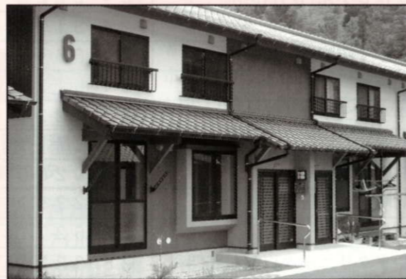
▲入居者を募集している東間団地