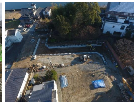
(区画道路の整備状況)