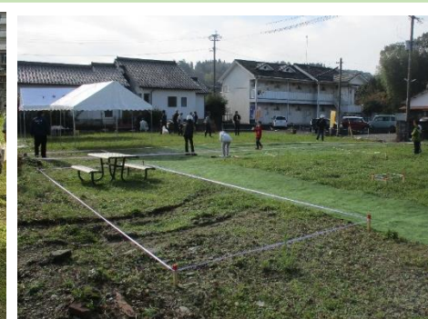
(公園の整備イメージ)