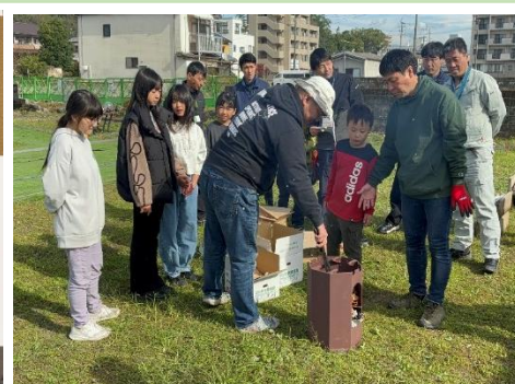
(かまどスツールを使った火起こし体験)