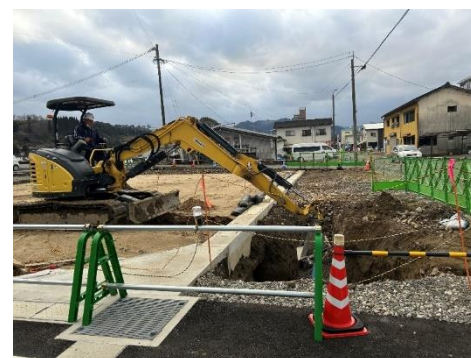
(国道445号の整備状況)

青井土地区画整理事業では、昨年11月18日に第6回土地区画整理審議会が開催され、当審議会では14画地が新たに仮換地指定となり、全107画地すべてが仮換地指定となりました。今後は早期の事業完了を目指して、随時工事を進めてまいります。