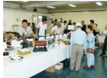
第1回公売会の様子

注意点 ・物件の引き渡しは買受代金納付時の現況のままで行います。 ・公売前に滞納税が完納になった差押物件については公売中止とします。