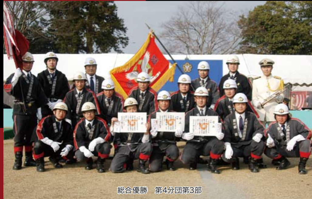
総合優勝 第4分団第3部