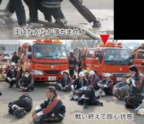
玉はなかなか落ちません