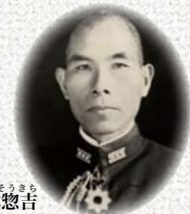
たかぎそうきち 高木惣吉