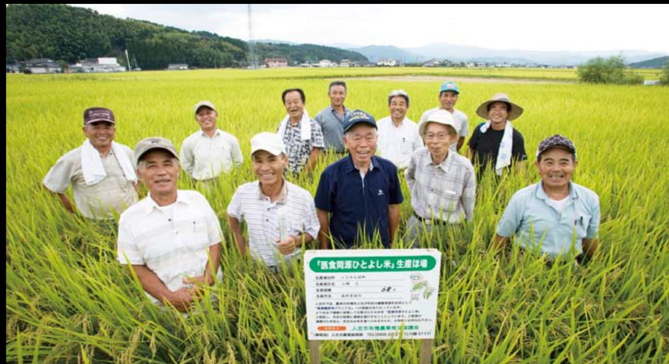
医食同源ひとよし米生産部会のみなさん (昨年9月の現地検討会)

人吉が好き。人と人のきずなを大切に 健康で笑顔で暮らせるまちづくりにはげむ 素敵な仲間がここにいる。