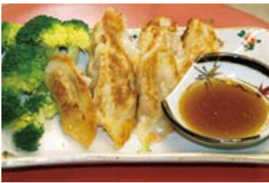
野菜のミックス漬のぎょうぎ風

子どものころ、正月前になると田舎の軒先には干し柿がきれいに吊るしてありました。母が年始めに実家へ行くと、必ず土産に貰ってききました。待つていて食べた時のおいしさは格別だったなあと思います。