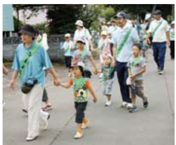
中原校区ウォーキング大会の様子