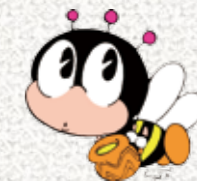
生涯学習マスコット「マナビィ」

場 所 東西コミセン 定 員 各100人 申込方法 下記申込先まで電話か直接お越しください。 申込時間 午前8時30分～午後5時(土日・祝祭日を除く) 申込締切 各開催日の3日前まで(ただし、定員になり次第締め切ります) 申込・問合せ 市社会教育課生涯学習係