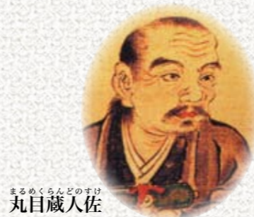
まるめくらんのすけ 丸目蔵人佐