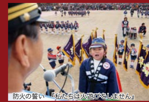
防火の誓い 「私たちは火遊びをしません」