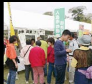
昨年の産業祭での試食会の様子

私たちのまち、人吉市。清流球磨川と人吉盆地の山々からなる山紫水明の大自然。そして歴史と文化を背景に伝統ある街並みやそこに住む人々。やさしい風、光、そして笑顔。その全てが癒しの世界。そんなわがまち人吉を、世界で一番健康で笑顔で暮らせるまちにしようと呼びかけている人たちがいます。 第8回は、医食同源ひとよし米生産部会の皆さんです。「医食同源」とは、病気を治療するのも日常の食事をするのも共に、命を養い、健康を保つためには欠くことができないもので、源は同じという意味。身体に良い食材を日ごろから食べて、病気を予防しよう、会の皆さんの作るお米は、まさにブランド名のとおり、「医食同源ひとよし米」です。 この会は、市長マニフェストのひとつ、「健康」を合言葉に、農産物のブランド化の