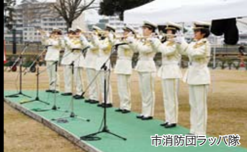
市消防団ラッパ隊