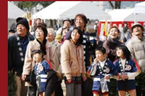
放水競技に見入る人々