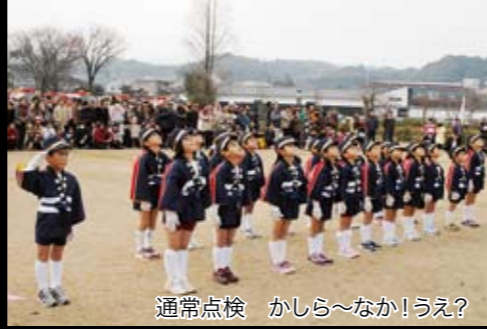
通常点検 かしら～なか!うえ?