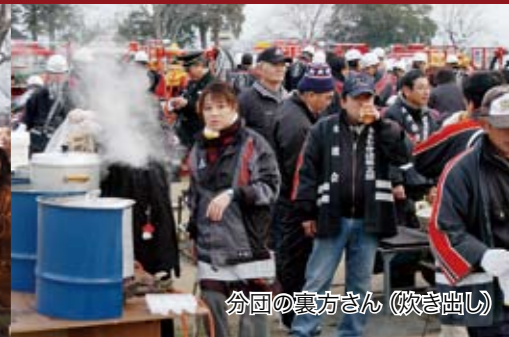
分団の裏方さん(吹き出し)