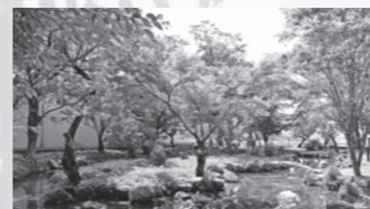
▲ 井口八幡神社庭園