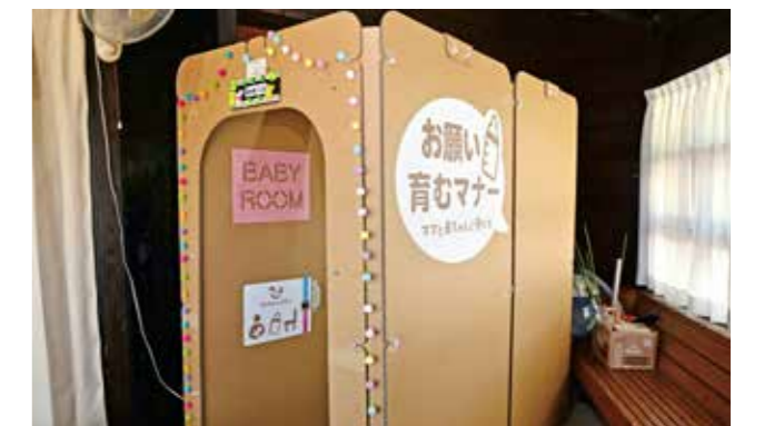
段ボール製で安全性とプライバシーを確保した授乳室

一般社団法人日本道路建設業協会は、一般社団法人全国道の駅連絡会と連携し、子育て支援の一つとして全国の道の駅に簡易設置型授乳室の設置を進めています。国土交通省が推進する道の駅の子育て応援施設の整備を後押しするものです。 同協会から道の駅人吉に県内で初めて簡易設置型の授乳室と授乳チェアが寄贈され、7月24日に寄贈式を人吉クラフトパーク石野公園の展示館で行いました。授乳室と授乳チェアは物産館内に設置していて、営業時間内に使用できます。