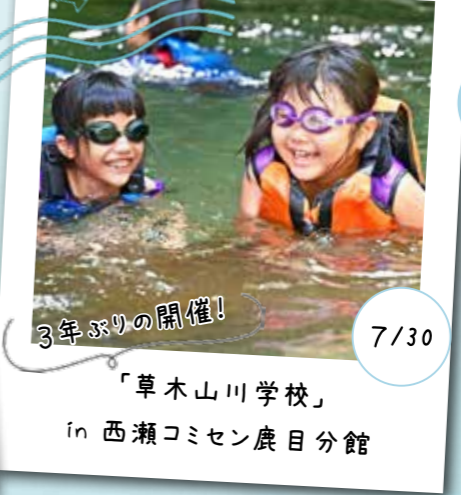
3年ぶりの開催! 「草木山川学校」 in 西瀬コミセン 鹿目分館