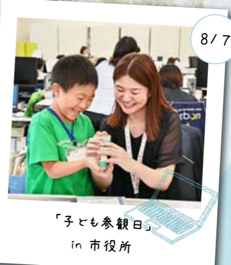
「子ども参観日」 in 市役所

市では、子どもや親子を対象に料理教室や川遊びなど夏休みならではのイベントを開催しました。暑さに負けず、笑顔で元気に楽しんだ子どもたちの夏休みを写真で振り返ります。