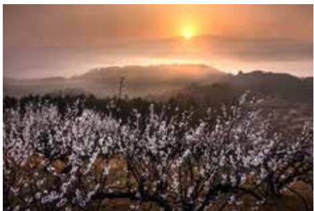
▲人吉梅園の写真。幻想的な雲海と朝日を脇役に、梅の木の配置に気を付けて撮影

「人吉は大好きなまち」。JR九州の社員として人吉駅に異動して約10年。休日はカメラを片手に人吉球磨や近隣地域の写真を撮り歩き、数々の写真コンテストで結果を残している。 アウトドアが好きで、休日は登山や溪流釣りを楽しむ。そこで出会う素晴らしい景色を写真に残したいと思い、平成30年にカメラの世界へ。本やインターネットを参考に独学で写真の撮り方を習得した。「静と動」をテーマに風景写真を撮り続け、令和2年にキヤノン主催のウェブ写真展で初めて入選。そしてベテランのカメラマンも入賞が難しいと口をそろえるハイレベルな写真コンテスト「KAN-I」