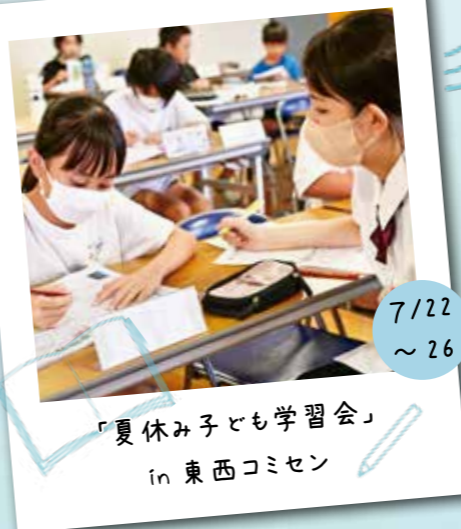
「夏休み子ども学習会」 in 東西コミセン