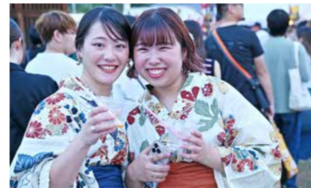
浴衣で訪れる人も多く見られた