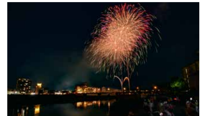
球磨川の川面を照らす大輪の花火