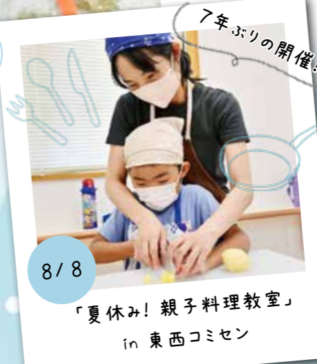
7年ぶりの開催! 8/8 「夏休み！親子料理教室」 in 東西コミセン