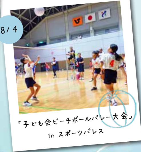
8/4 「子ども会ビーチボールバレー大会」 in スポーツパレス