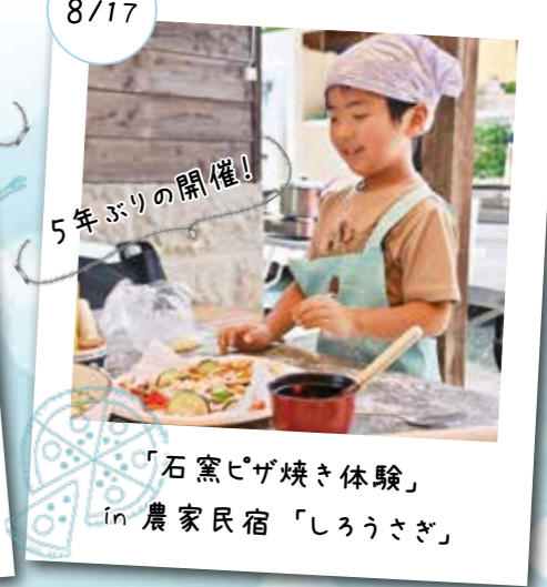
8/17 5年ぶりの開催! 「石窯ピザ焼き体験」 in 農家民宿「しろうさぎ」