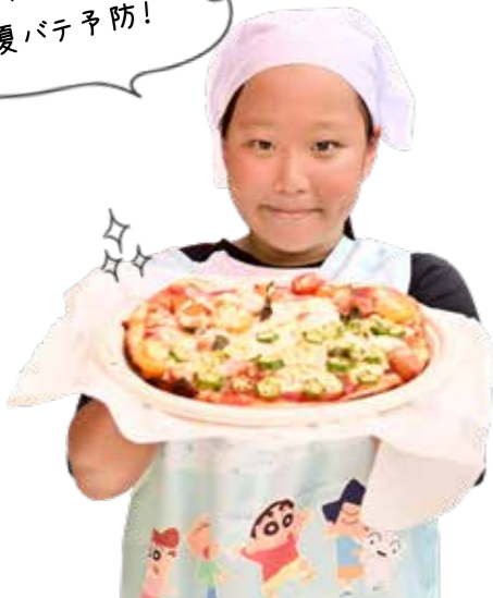
写真 1・2 子ども参観日

市職員の子どもが、保護者の職場を見学。手作りの名刺を市長と交換した後、保護者の仕事を体験しました