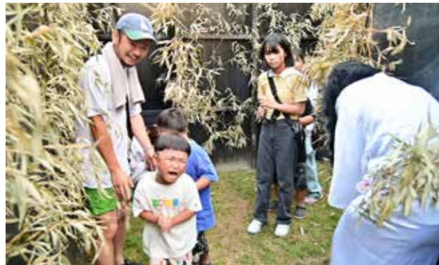
突然現れる幽霊に悲鳴を上げる子どもたち

幽霊寺として知られる永国寺（土手町）で、8月3日にゆうれい祭りが開催されました。地元消防団を中心とした実行委員会が主催したものの、墓場を通じて入る幽霊屋敷では驚いた子どもたちが悲鳴を上げたり泣き出したりと、大いに怖がっていました。 宮崎県から家族で訪れたという母親は「年に1度だけ本物の幽霊の掛け軸が開帳されるのを見て来た。市内観光もできた」と笑顔。屋台にも長蛇の列ができて、家族連れや若者らでにぎわっていました。