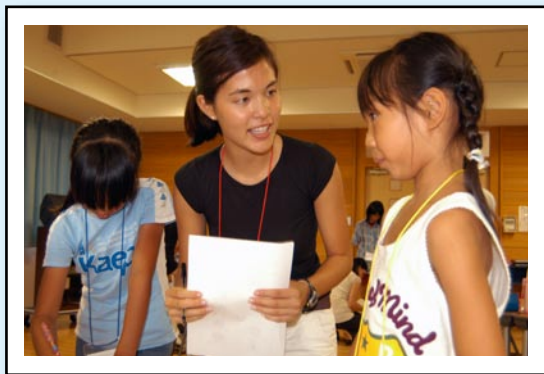
▲ ハローから始まるふれあい in 人吉（8/27） 「ゲームを通じて外国を身近に感じてもらいました」