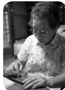
■詰さん（81歳） ・上林町在住 ・直営温泉利用