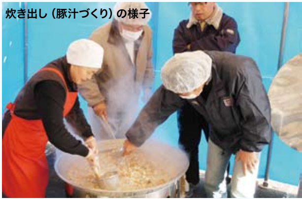
炊き出し（豚汁づくり）の様子

12月28日に人吉市総合福祉センターで、就労や生活などの相談を「ワンストップ生活就労相談会」が開かれました。この相談会は、年末年始に抱える不安を少しでも軽くして欲しいと市と社会福祉協議会が関係機関に呼びかけて行ったもので、今回が初めての取り組み。この日は、20代から70代までの37件の相談があり、ハローワークの職員や弁護士、ケーサーワーカーなどが対応しました。また、ボランティア30人と市職員が、豚汁と「医食同源ひとよし米」のご飯を相談者に振舞いました。