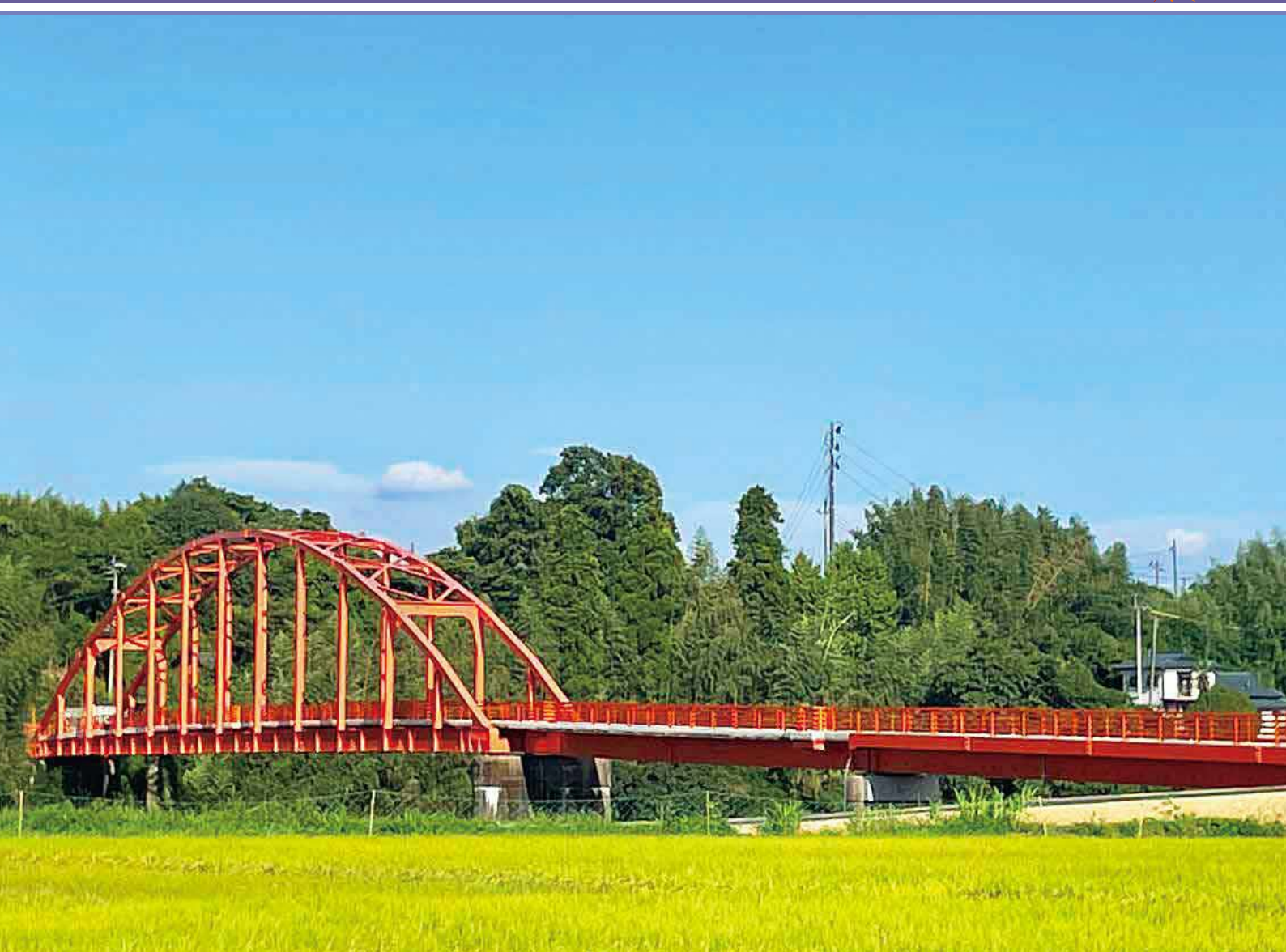
朱色 柿色 唐紅 変幻自在 天狗橋