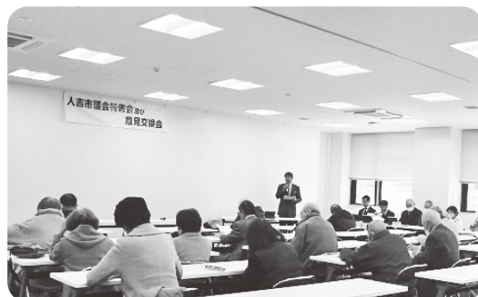
昨年の報告会・意見交換会