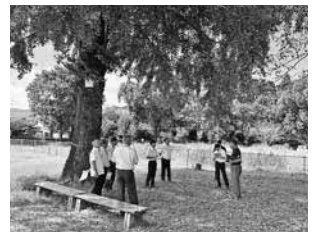
現地視察：大畑小学校樹木伐採