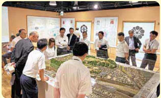
人吉城歴史館視察の様子