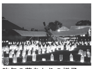
昨年の夢あかりの様子

日時 10月22日(土) 午前10時～午後9時 10月23日(日) 午前10時～午後9時