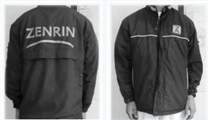
▲ゼンリンの調査員は紺色のスタッフ用ジャンパーと腕章を着用し、社員証または調査員証を携行しています

理解いただきご協力をお願いします。 調査目的 空き家の実態調査のため(建築物の形態や景観などを把握) 調査期間 11月中旬～平成30年2月20日(火) 調査員 株式会社ゼンリン熊本営業所の社員(ジャンパーを着用し社員証または調査員証を携行しています)