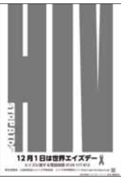
▶世界エイズデーのポスター

れます。 感染から発病まで数年の潜伏期がありますが、早期に発見し治療を始めることで発病を予防したり、遅らせたりすることができま。大切な人への感染を防ぐためにも、一度検査を受けましょう。 内容 採血によるエイズ検査 期日 11月29日(水)～12月5日(火)の平日 時間 午後5時～7時(予約制) 場所 人吉保健所 ※人吉保健所では、毎週火曜日の午前9時～11時、毎月第3火曜日の午後5時～7時に検査を実施しています。詳しくはお問い合わせください。 問合せ 人吉保健所(☎22-3107)