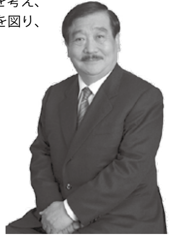
吉村 作治（よしむら・さくじ）

1966年アジア初の早大エジプト調査隊を組織し現地に赴いて以来、40年以上にわたり発掘調査を継続、数々の発見により国際的評価を得る。 メディアでは、「世界ふしぎ発見！」やCMなどに多数出演。