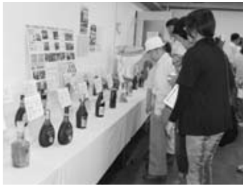
第1回公売会のようす

③本人確認ができるもの(運転免許証、健康保険証など) ④委任状(代理人が入札する場合のみ)