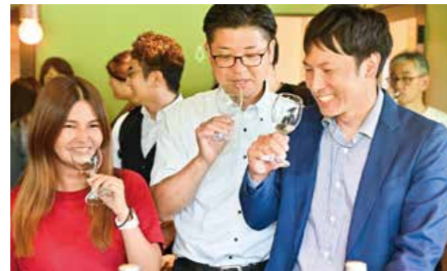
酒を水で割る文化がない海外でも楽しめるよう開発

「人吉球磨を蒸留の聖地へ」を合言葉に球磨焼酎の魅力向上を目指し、流通・飲食店・酒造関係者らでつくるプロジェクトチーム「KUMA SPIRITS AND BOTTLERS」の第1弾となる商品が発表されました。第1弾は球磨焼酎4～5種類をブレンドし人吉球磨の地下水で割ったものなど4種類。6月4日の試飲会では、報道関係者や観光関係者ら約40人が参加し、焼酎の香りや味わいを楽しみました。同商品は、地元の酒販店や海外でも販売予定です。