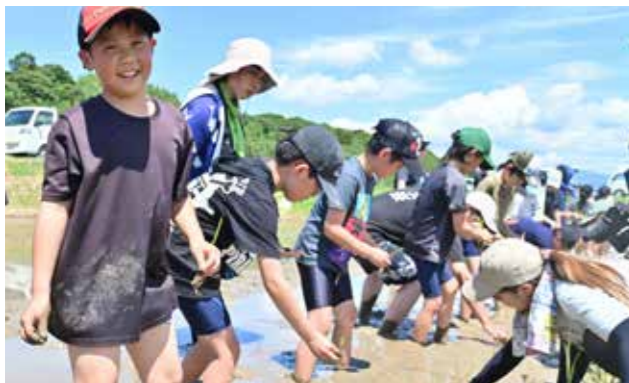
目印に合わせ規則正しく苗を植える児童たち

中原小の4年生54人が、6月13日にアイガモ農法の田植えを体験しました。同小では1年を通してアイガモ農法による米作りを座学や体験で学んでいます。児童は学校支援ボランティアから苗の植え方を教えてもらい、恐る恐る水田の中へ。慣れない手つきで苗が倒れてしまうこともありましたが、1本1本丁寧に植えました。これから雑草や虫を食べてくれるアイガモを放鳥し、餌やりなどの世話や米の収穫などを通して米作りを学んでいきます。