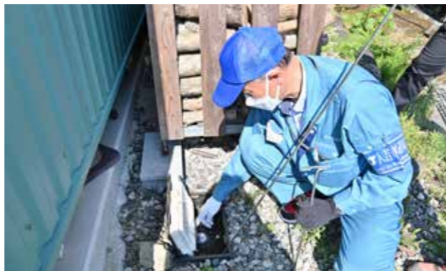
水道事業者9人と市職員4人で調査