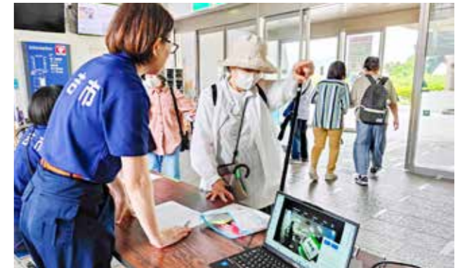
参加者は避難経路などを確認しながら避難所へ向かった

市は、令和2年7月豪雨の教訓を踏まえ、「みんなで避難行動を確認する日」として自主避難訓練を5月26日に実施しました。訓練では、防災行政無線や消防団の広報活動などによる情報発信を行い、小学校やコミセンなど8カ所に開設した指定避難所に231人が避難しました。町内独自で避難訓練を実施した上新町町内会では、観音寺に町内の89人中40人が避難。電話を使った伝達訓練や避難経路・避難場所の確認も行い防災意識を高めました。