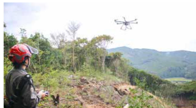
▲ドローンを使い、シカの食害防護柵の材料を運搬