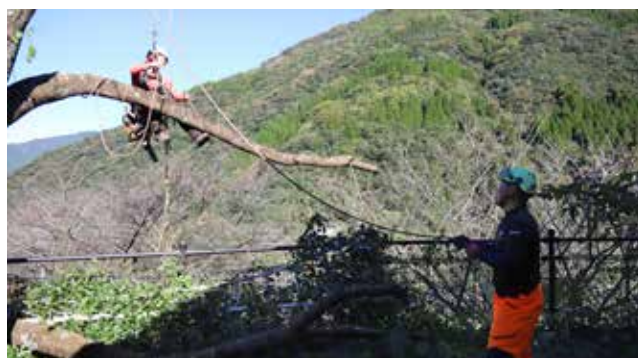
▲グラウンドワーカーと確認しながら安全に作業する

平成24 (2012) 年に会社を設立。5人の従業員とともに、九州を中心に特殊伐採をメインに事業を展開する。モットーは「切れない木はない」。