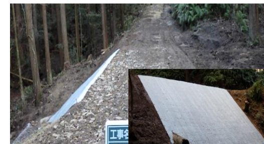
林道の法面復旧 (林道大谷線・古仏頂町)