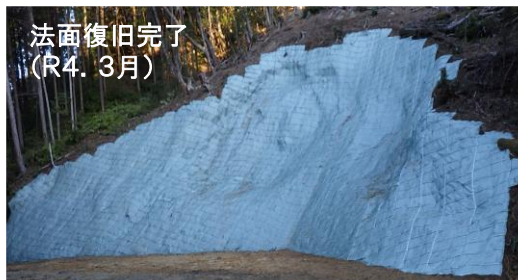
法面復旧完了 (R4. 3月)