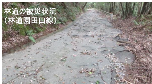
林道の被災状況 (林道園田山線)