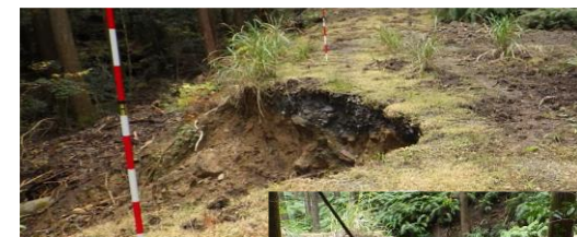
被災状況 (林道大谷線)