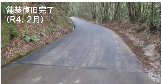
舗装復旧完了 (R4. 2月)