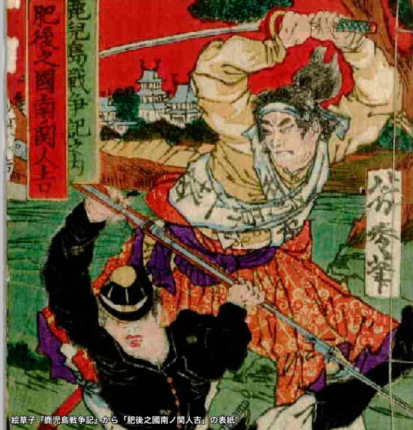
絵草子『鹿児島戦争記』から「肥後之國南ノ関人吉」の表紙