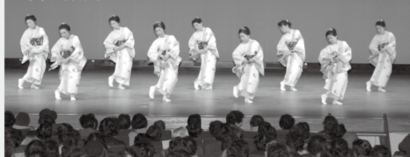
※昨年の演芸会から

期日 12月2日(日) ◆昼の部=午前11時開演 ◆夜の部=午後5時開演 会場 カルチャーパレス大ホール(開場は開演1時間前) 入場料 1,000円 ※チケットは、各町内会長または各種団体からお買い求めください。 益金は、歳末たすけあい見舞金として配分されます。 問合せ 市社会福祉協議会(☎24-9192)