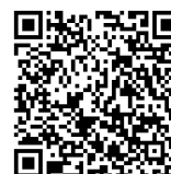
アンケート調査 QRコード

今回、当社会実験中の利用状況や周辺環境に関するご意見をお伺いし、今後のまちづくりや青井阿蘇神社周辺の整備方針、並びに利用ルール等の検討に活用させていただくため、アンケート調査を実施いたします。アンケートは、以下のQRコードからオンラインアクセスいただきご回答をお願いします。ご回答の程ご協力をよろしくお願いします。