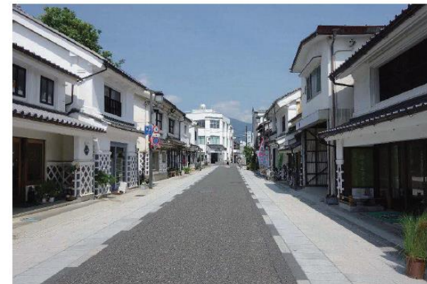
事例：長野県松本市中央中町通り