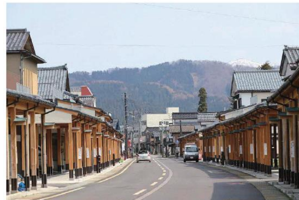
事例：新潟県加茂市駅前

R 5 年度当座談会において「落ち着いたある暮らしを大切にしたいまちづくり」を目指すとし、今回、改めて青井地区におけるまち並みのあり方について、意見交換を実施しました。