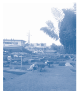
▲赤池原遺跡発掘現場

参加費 無料 ※ 駐車場あり。直接現地へお越しください。 問合せ 市歴史文化課歴史文化係