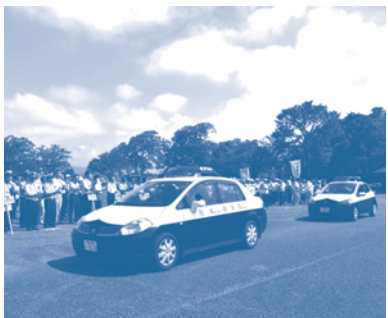
▲ 昨年の出発式の様子