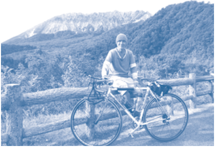
▲火野正平さん

申込・問合せ NHKふれあ いセンター(☎0570・ 066・066または050 ・3786・5000 FAX 03・3465・1327 〒150・8001 NHK 「こころ旅」係 番組ホームページ http://www.nhk.or.jp/ kokorotabi/