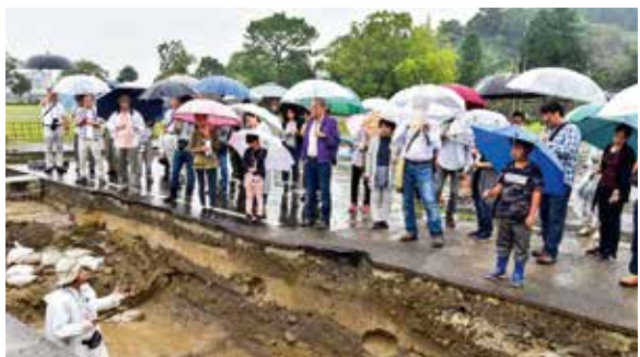
麓町本庁舎跡地発掘調査現地説明会

め、「人吉ふれあい百円商店街」に合わせた移動図書館車の派遣をこれまでに3回実施し、多くの方々に本に触れる機会を提供できました。日本遺産関係ですが、人吉球磨のストーリー「相良七百年が生んだ保守と進取の文化日本でも最も豊かな隠れ里人吉球磨」については、平成29年4月に新たに16件の構成文化財をお認めいただき、構成文化財を57件として人吉球磨が一体となった日本遺産の魅力づくりを進めてきました。