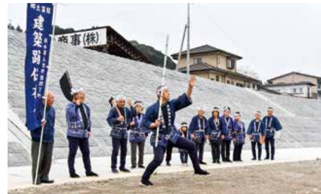
堤防完成を祝し、西間下町建築踊りも披露された

国土交通省が西間下町の球磨川左岸で平成29年度から工事を進めていた堤防が完成し、2月24日に現地で式典が開催されました。昭和40年に発生した水害を機に、国はこれまで市内中心部の築堤を進めてきましたが、人吉橋下流の堤防が完成し、築堤事業が終了しました。 完成した堤防は全長1000m、幅30m、高さ5m。管理用の坂路も設けられ、河川監視カメラも設置される予定です。式典は地元住民などで構成する実行委員が主催し、参加者約50人で祝いました。