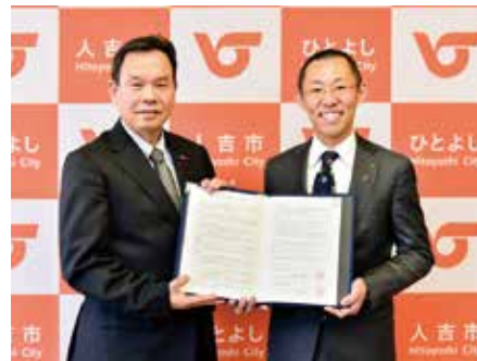
井戸水等の提供に関する協定書締結