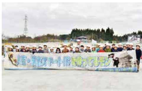
スマートインターチェンジ工事現場見学会

街路事業関係ですが、都市計画道路下林願成寺線道路改築事業については、平成30年3月から道路北側歩道部の着工をしています。事業の進捗率は72%で、未買収の土地の所有者に理解を求めながら用地交渉に努め、早期の完成を目指していきます。戸建木造住宅の耐震化を促進する戸建木造住宅耐震改修