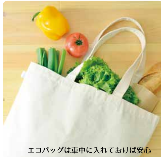
エコバッグは車中に入れておけば安心

2030年に向けた新しい国民運動「COOL CHOICE (=賢い選択)」日頃の小さな選択の積み重ねが、大きな変化につながります。