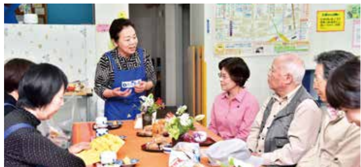
認知症カフェ「Dカフェ青い鳥」が九日町にオープン

物産振興関係ですが、熊本市の「びぶれず広場」において人吉物産振興協会と人吉商工会議所が合同で物産展を開催し、特産品と観光双方の知名度アップにつながっています。また、球磨焼酎の海外への販路拡大支援として米国のバイヤーなどを招へいして商談会を開催し、友好都市の牧之原市では「牧之原市に球磨焼酎を広める会」が発足し、球磨焼酎の普及に取り組んでいただいています。私も平成30年5月に香港で開催されたアンテナショップ「樽杏」の一周年記念式典に参加し、球