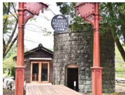
大畑駅のレストラン「LOOP」

大規模災害時の生活用水確保や公衆衛生維持を目的として平成30年12月に設けた災害時協力井戸制度について、福祉株式会社熊本工場と「災害時における井戸水等の提供に関する協定書」を締結。この協定により広域的な断水の際、上水道が復旧するまで飲料以外の生活用水として井戸水を提供していただくことが可能になりました。また、災害廃棄物対策として災害の規