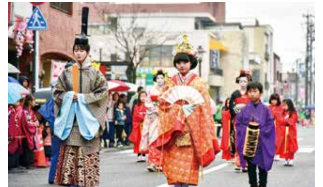
人間びなや舞子が九日町でパレード

今年も2月1日～3月24日まで「人吉球磨は、ひなまつり」が開催されました。市内も九日町のおひな通りなどで個性豊かなひな人形が飾られ、まちを彩りました。 3月3日には小雨が降る中、市内各地でイベントが開催され、各会場は多くの来場者でにぎわいました。九日町通りで行われた「おひなまつりパレード」では、化粧をし、きらびやかな衣装を身にまとった人間びなや舞子が登場。観客は、華やかな人間びなたちを写真に収めようとカメラを向けていました。