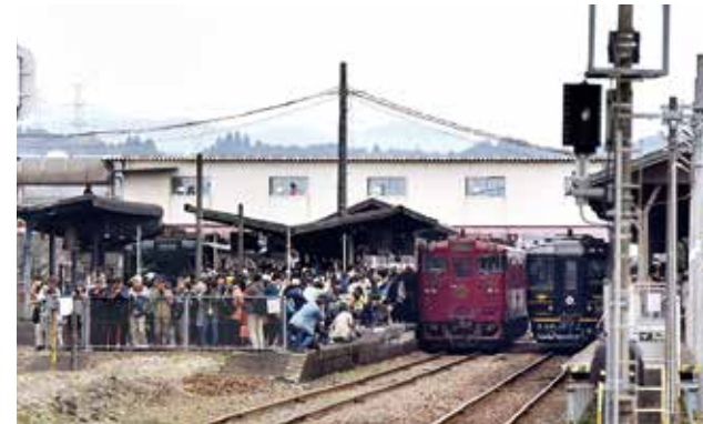
観光列車の夢の共演を撮影しようと殺到するお客さんたち

SL人吉の運行10周年を記念し、人吉駅で3月22日～23日の2日間にわたり観光列車サミット in 人吉球磨が開催されました。初日は人吉駅にJR九州とくま川鉄道の観光列車6列車が集結。駅構内には多くの鉄道愛好家や家族連れが押し寄せ、写真撮影を楽しみました。23日は「観光列車とまちづくり」をテーマに地域活性化にちなんだシンポジウムを開催。 両日ともプラレールのジオラマ展示やミニトレイン運行、列車グッズ販売などが行われ、人吉駅は大いににぎわいました。