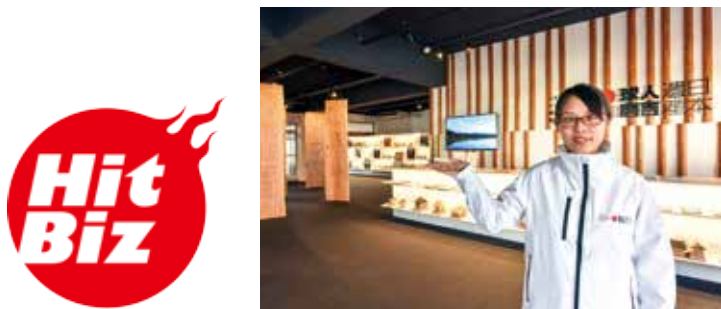
「Hit Biz」のロゴマーク（左）とくまりば

め、平成30年3月に日本遺産人吉球磨観光地域づくり協議会を発足。10市町村と関係団体の長による理事会や企画運営委員会、若手事業者によるワーキング会議で活発な議論が展開されています。 人吉市まち・ひと・しごと総合交流館は日本遺産人吉球磨エントランスセンターと温泉施設を併設し、平成30年7月にプレオープンしました。市民の皆さんにも日本遺産人吉球磨の魅力に「見て・聴いて・触れて」いただける集いの場として利用いただいています。平成31年1月末現在の累計来館者数は9千人を超え、人吉しごとサポートセンター「Hit Biz」と連携し、交流人口の増加や雇用の創出をもたらす施設として推進していきます。