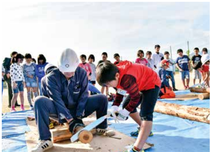
小学生を対象にした林業教室