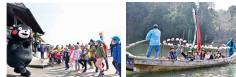
発船を見送るくまモンや旅館のおかみさんたちと飾り舟(上) /川下りを楽しむ乗客たち(下右) /くまモンと一緒にくまモン体操をする園児たち(下左)