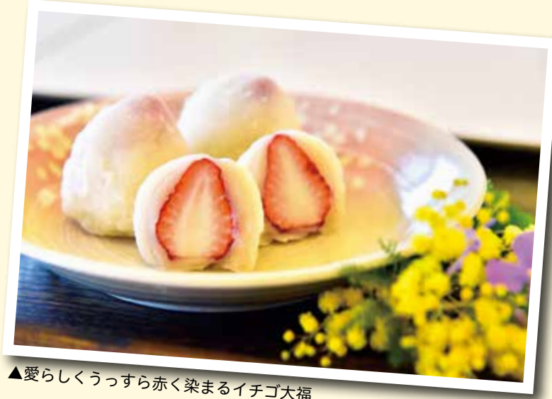
▲愛らしくうっすら赤く染まるイチゴ大福

イチゴの旬の時期に作りたくなる一品。白あんのイチゴ大福は上品な味わいになり、見た目もきれい！小ぶりのイチゴを使うと上手に包むことができますよ。生地が柔らかく子どもも扱いやすいので、ぜひお子さんと一緒に作ってみてほしいです。