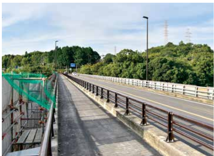
長寿命化への工事が進む曙橋

川辺川総合土地改良事業ですが、平成30年2月に国営川辺川土地改良事業廃止処理計画に基づく農業用排水事業の廃止が確定しました。今後は、3力年の計画期間により造成団地の水手当てに伴う実施設計と施設整備等が推進される見込みです。