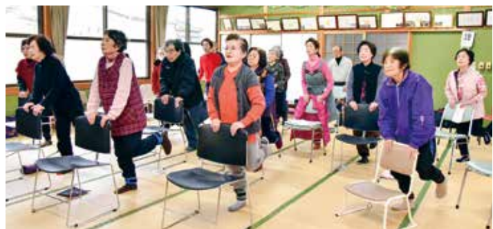
縁側ふれあいサロンで「人吉ころばん体操」をする参加者

母子保健関係ですが、平成28年4月から特定不妊治療費助成事業を開始し、経済的負担軽減と安心して妊娠・出産できる環境づくりに努め、翌年には子育て世代包括支援センターを開設し、母親が抱える問題の早期解決や継続的な支援に取り組みできました。また、妊婦健康診査については、平成29年6月から歯科健康診査を追加し、早産を引き起こす危険性を減らす取り組みを進めています。