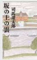
しば りゅうたろう 司馬 遼太郎著

この本は伊予松山出身で明治の騎兵隊の創設者の秋山好古、その弟で海軍参謀の秋山真之、そして近代俳句・短歌の祖である正岡子規の3人が友情と成長そして情熱を通じ、若々しく勃興する明治国家を背景に当時の青春を描く歴史小説です。長編ですが気軽に楽しく読める一冊です。