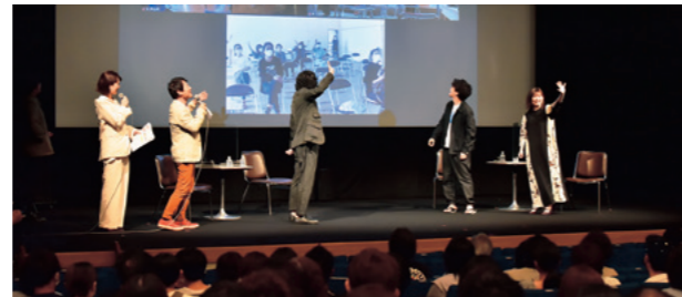
▲昨年の様子。上映後に監督や出演者がステージに登壇した