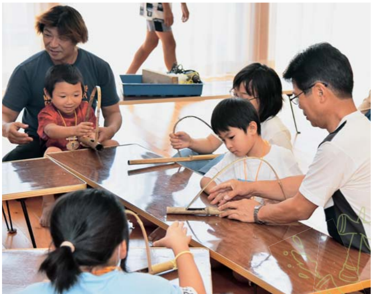
竹鉄砲の使い方を教わる子どもたち