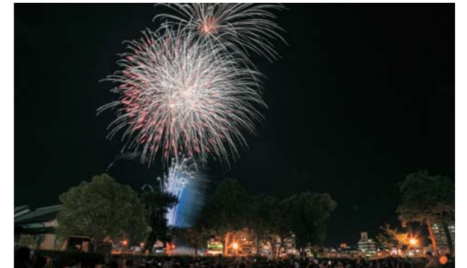
約4万人の観覧客でにぎわった今年の花火大会

お盆の風物詩である人吉花火大会を、8月15日に開催しました。今年は天候に恵まれ、涼しい風も吹いて花火の煙が適度に流れる絶好の花火日和。新型コロナウイルス感染症による制限がなくなつて初めての開催で、観覧場所のふるさと歴史の広場や球磨川沿いには出店が並び、夕方には浴衣姿のグループや家族連れなどでにぎわいました。 午後7時30分に打ち上げを始める約3千発の花火が夜空を彩り、集まった人たちは動画を撮影したり拍手を送ったりと思いに楽しんでいました。