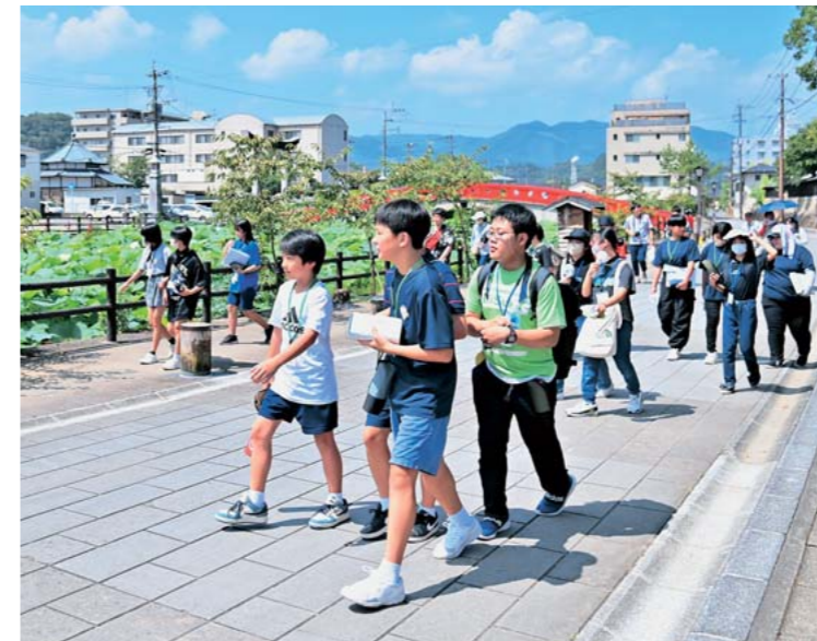
被災地の視察を通して防災や減災の大切さを学んだ