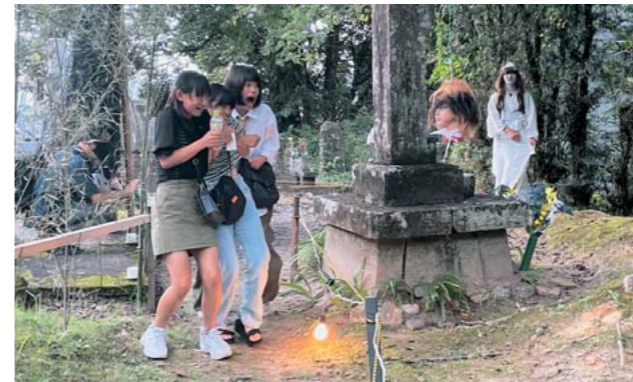
絶叫と笑顔が入り交ざり、大盛況だったゆうれい屋敷

ゆうれい寺として知られる永国寺（土手町）で8月5日に「ゆうれい祭り」が開催されました。地元消防団を中心とした実行委員が主催したもので、新型コロナウイルス感染症と豪雨災害の影響で4年ぶりとなつて、会場は家族連れや若者たちで大にぎわい。出店やゆうれい屋敷には長蛇の列ができていました。 初めて祭りに来たという40代の夫婦は「本格的なゆうれい屋敷も驚いたが、たくさんのお客が集まっていることにも驚いた」と笑顔。活気あふれる祭りの雰囲気を楽しんでいました。