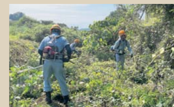
▲御年69歳の森山副社長も参加