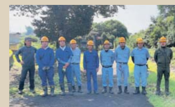
▲くま川鉄道除草部隊

全員が当たり前のように刈り払い機を扱って草刈りをしていて、くま川鉄道ってすごいと思いました。鉄道業務だけでなくこういった仕事も全員で行うんですね。まさにプロフェッショナルです!!