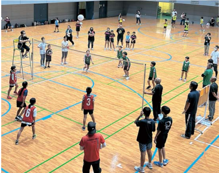
女子の部2チーム、混合の部8チームの合わせて10チーム68人が出場