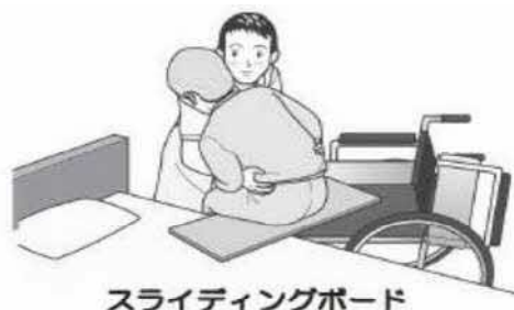
スライディングボード

対象者の体幹をやや前傾した状態で、左右交互に傾けて荷重を片側の臀部にかけ、次に荷重がかかっていない臀部の膝を車椅子背もたれ方向へ押すことで深く座ることができる。滑りにくい座面の場合は、片側のみスライディングシートを座面に敷き、同様に膝を押すことで滑りやすくなり深く座ることができる。