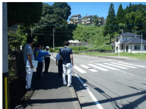
緊急合同点検状況