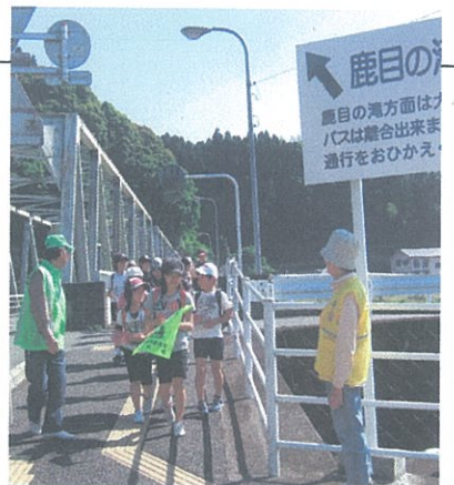
ボランティアと保安官に見守られ一斉下校する児童

募集等に取り組みました。更に支援活動の試行として、各学校から要請のあった支援活動を実施しました。本年度は、引き続きボランティアを募集しながら、支援活動を本格的に展開していきたいと考えています。各学校の支援活動の積極的な活用を期待しています。