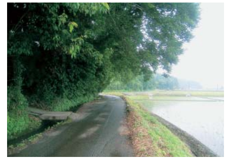
▲道路に張り出した樹木

道路や歩道への樹木の張り出しや倒木が原因で歩行者や自動車事故を起こした場合は、その樹木の所有者が責任を問われる場合があります。次のような状態の樹木の所有者は、伐採や枝払いをお願いします。 ①道路や歩道に樹木や竹林など