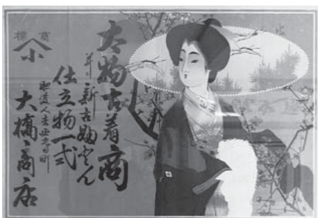
▲探している物品例：明治時代の引き札

人吉城歴史館では、10～12月に特別展「明治・大正時代の人吉(仮)」を開催する予定です。そこで、次に当てはまる物品や資料の収集・情報