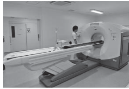
▲がんを検査して画像化するPET-CTの装置

特定テーマごとの労働相談 県しごと相談・支援セン ターでは、特定テーマごとの 労働相談を実施します。来所 されるか電話でご相談くださ い。 日程 3月5日(水)・19日(水) テーマ 解雇、退職勧奨・退 職、雇止めについて 相談時間 午後1時～4時 相談場所 県しごと相談・支 援センター(熊本市中央区水 道町8・6 朝日生命熊本ビ ル1階) ※テーマ以外の相談も受け付 けます。 問合せ 県しごと相談・支 援センター労働相談コー ナー(☎096・352・ 3613)